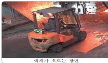
액체가 흐르는 장면

'20.6. 원자재를 용해로에 넣는 작업 중 자재에 고여 있던 물이 수증기로 폭발하여 사망